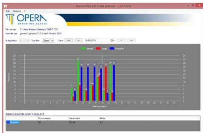
Analisi grafica giornaliera